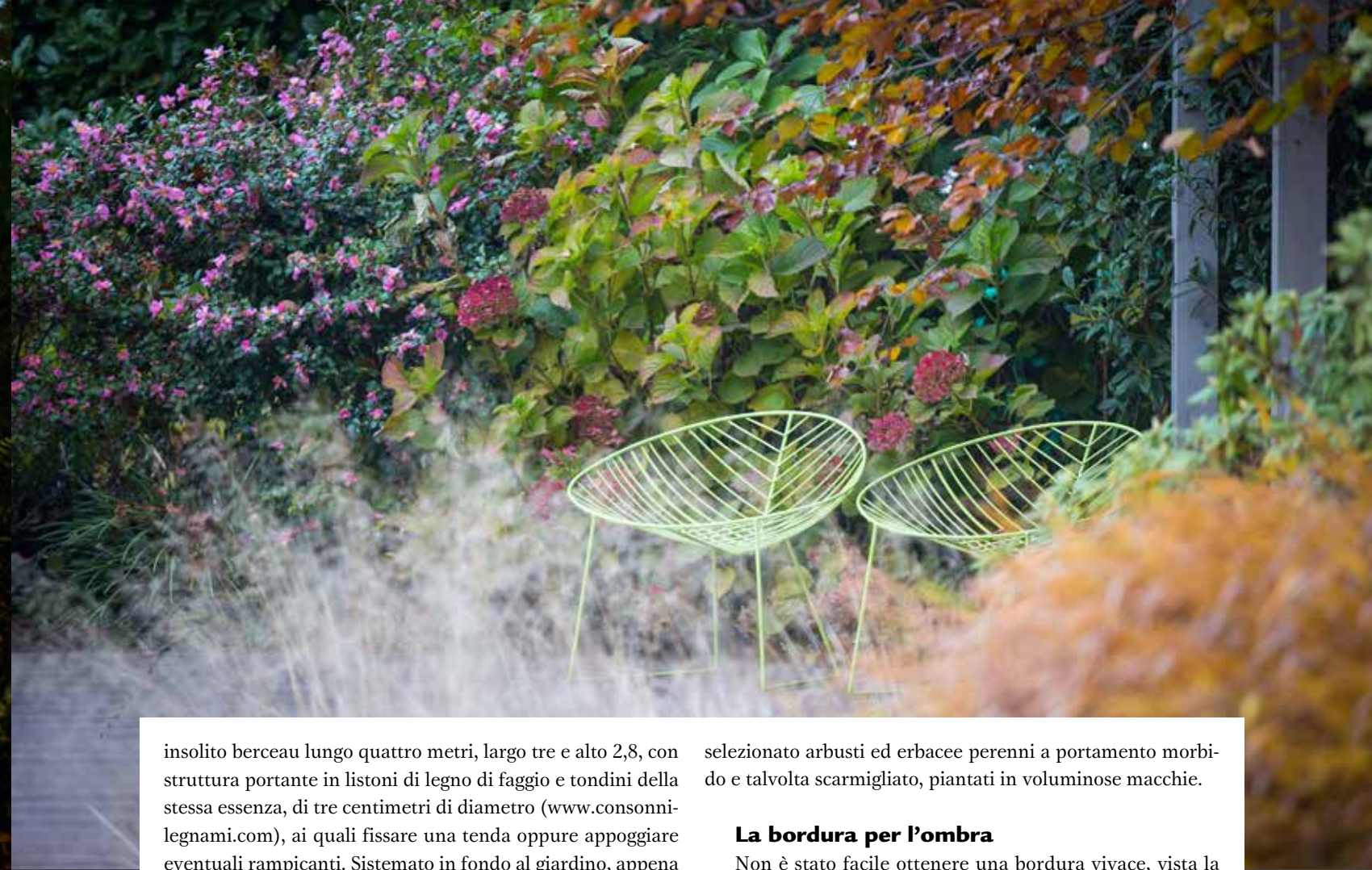
In questa foto: le eleganti foglie di Mahonia confusa 'Nara Hiri'. Sopra: il berceau in legno di faggio misura 4 per 3 m ed è alto 2,8 m. Pagina accanto: Camellia sasanqua e Hydrangea macrophylla in fiore fanno da sfondo alle poltroncine Leaf-Slitta Lounge di Arper (www.arper.com). In primo piano, fuori fuoco, Hakonechloa macra 'Aureola' e Deschampsia cespitosa .